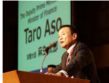
麻生財務大臣スピーチ