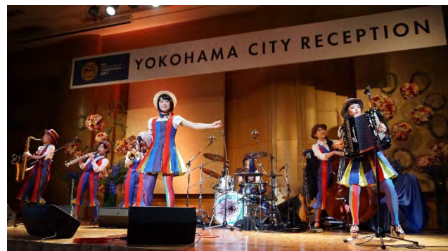
チャラン・ポ・ランタンによるパフォーマンス