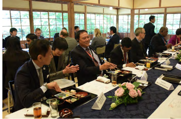
ムスリムの方向けの食事をご用意