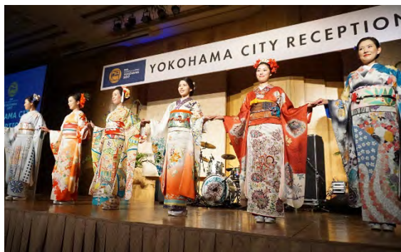
KIMONO PROJECT の紹介