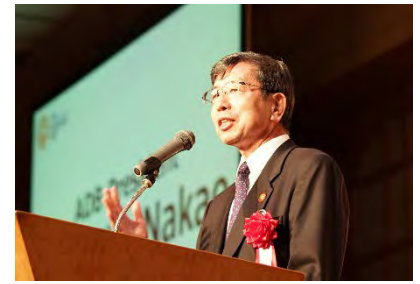
中尾総裁スピーチ