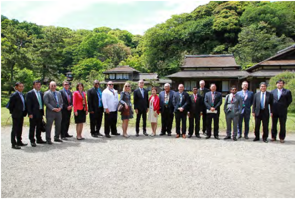
国重要文化財・三溪園の臨春閣前で記念撮影