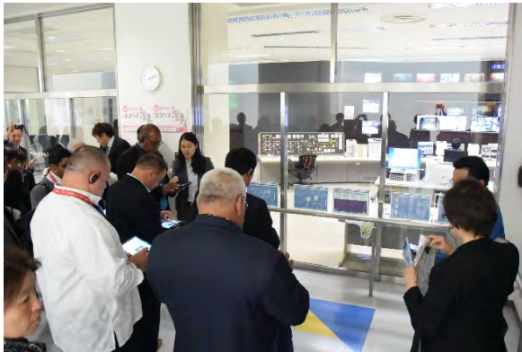
タブレットを使った施設の説明