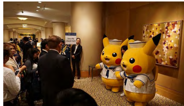
ピカチュウによるグリーティング