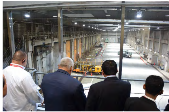
熱心に施設を見学される参加者の皆様